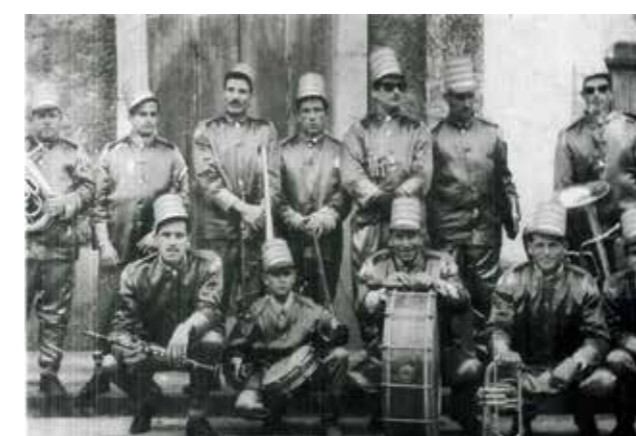
Fanfarra da Banda Ovarense (1965)