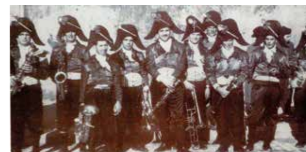
Grupo formado por elementos da Banda de Loureiro no Carnaval de Ovar. Foto datada de 1949, tendo, à esquerda, o pai do autor deste texto. (Em "Banda de Música de Loureiro - Uma Banda Centenária", 2019, por Manuel Pires Bastos)