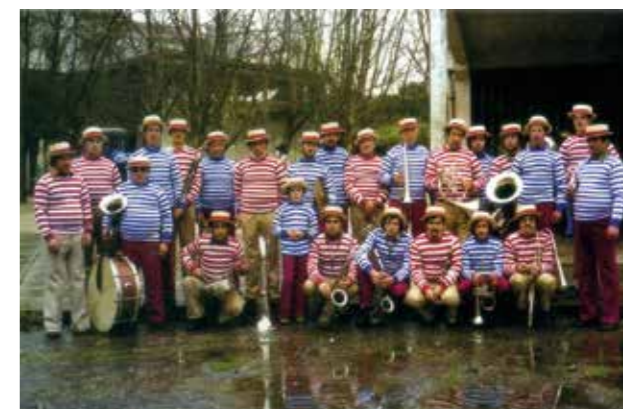
Banda do Lau I e II (1980), com músicos da Banda Velha e da Banda Nova de Ovar. (Em "O Carnaval de Ovar", 2019, por Jorge de Almeida e Pinho e Guilherme Terra)